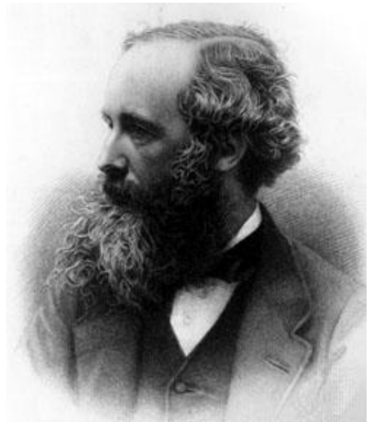
馬克斯威（James Clerk Maxwell, 1831-1879）

（Albert Einstein）毫不諱言地說：「特殊相對論源自於馬克斯威的電磁場方程式」；敲響量子力學之鐘的布郎克（Max Planck）則謂：「他（馬克斯威）的偉大無人能比！」事實上，物理世界（Physics World）雜誌在 20 世紀結束前，對 100 位當時最傑出之物理學家的問卷調查中，馬克斯威被評選為有史以來第三大物理學家，僅次於愛因斯坦和牛頓。可是除了學物理和化學的科學家外，又有多少人知道他呢？更遑論家喻戶曉了！因此決定寫一篇專文介紹他。